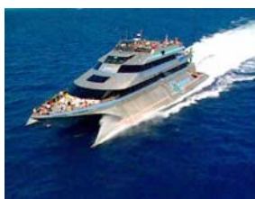
Ausflugsboot Barrier Reef